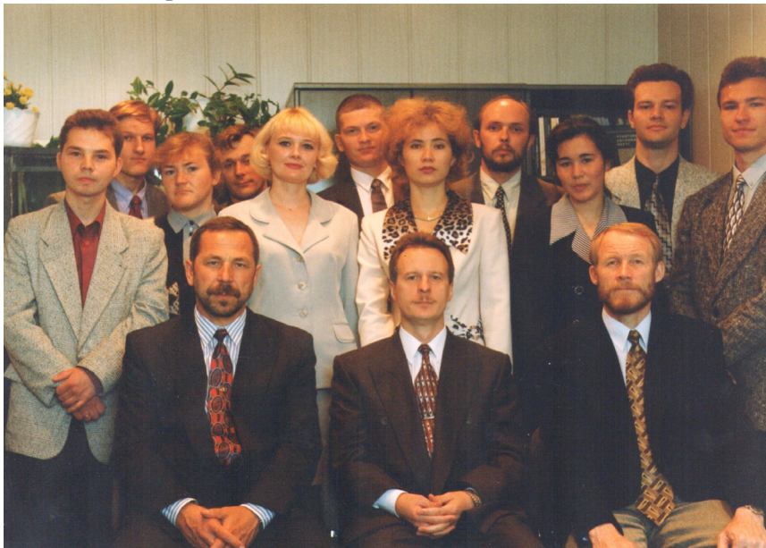
Рис. 2. Коллектив ЧукотТИНРО в 1997–1998 гг.